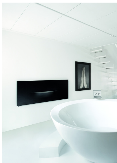
Cut Horizontal double