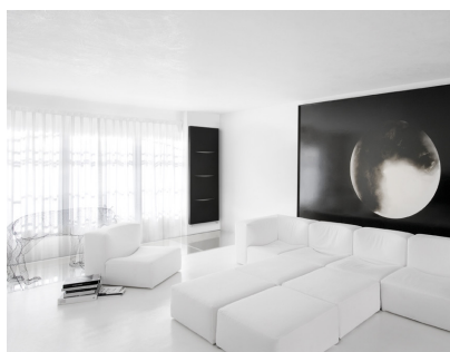
Cut Vertical double