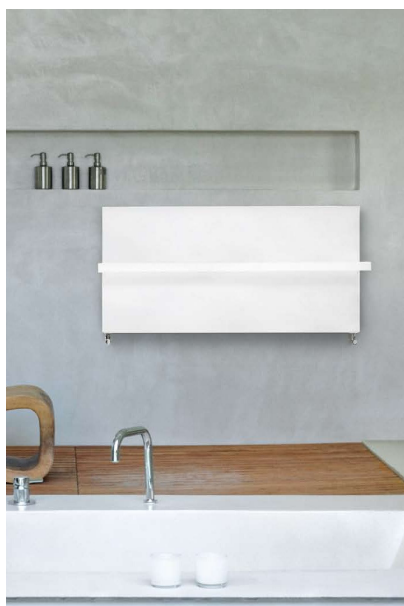
Ice Bagno Horizontal